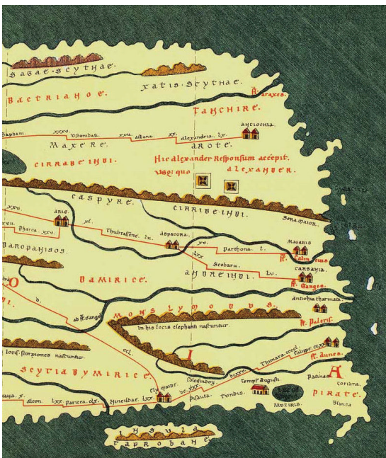
Abbildungen: Muziris-Papyrus (G 40822 Pap, Österreichische Nationalbibliothek) und Tabula Peutingeriana (Ausschnitt), Erstdruck Venedig 1591

Sonderforschungsbereich 933 an der Universität Heidelberg, gefördert von der Deutschen Forschungsgemeinschaft Kooperationspartner: Hochschule für Jüdische Studien Heidelberg